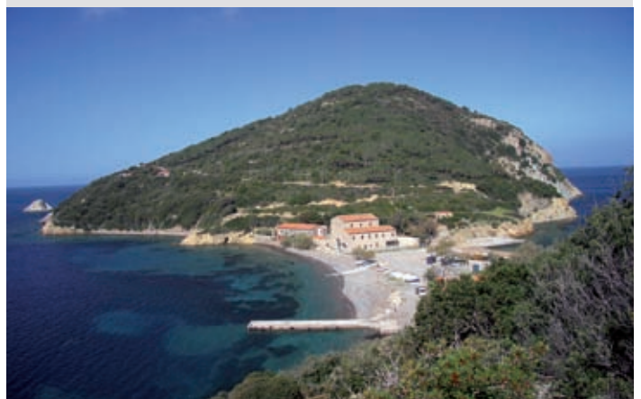
5 Enfola con Tonnara, Portoferraio