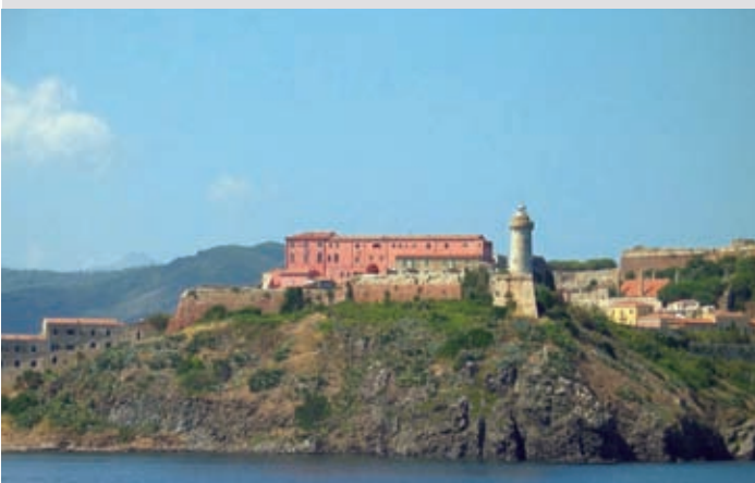
4 Forte Stella, Portoferraio

Marine e Marinerie dell'Elba – Santuari ed Ex-Voto.