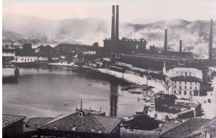
2 Gli Alt Forni di Portoferraio