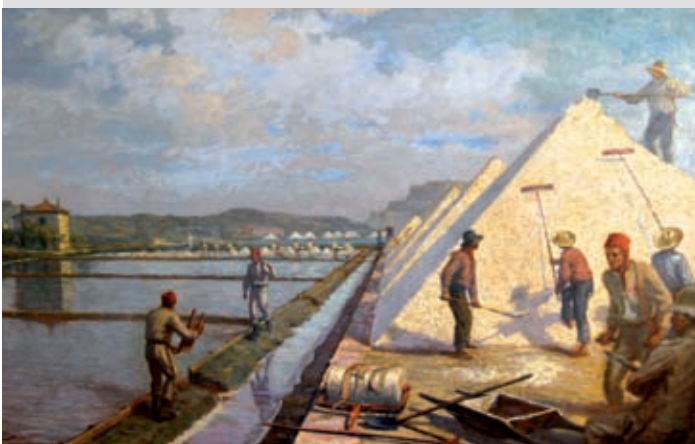
1 L. Mazzei, Saline Elbane, Pinacoteca Foresiana, Portoferraio