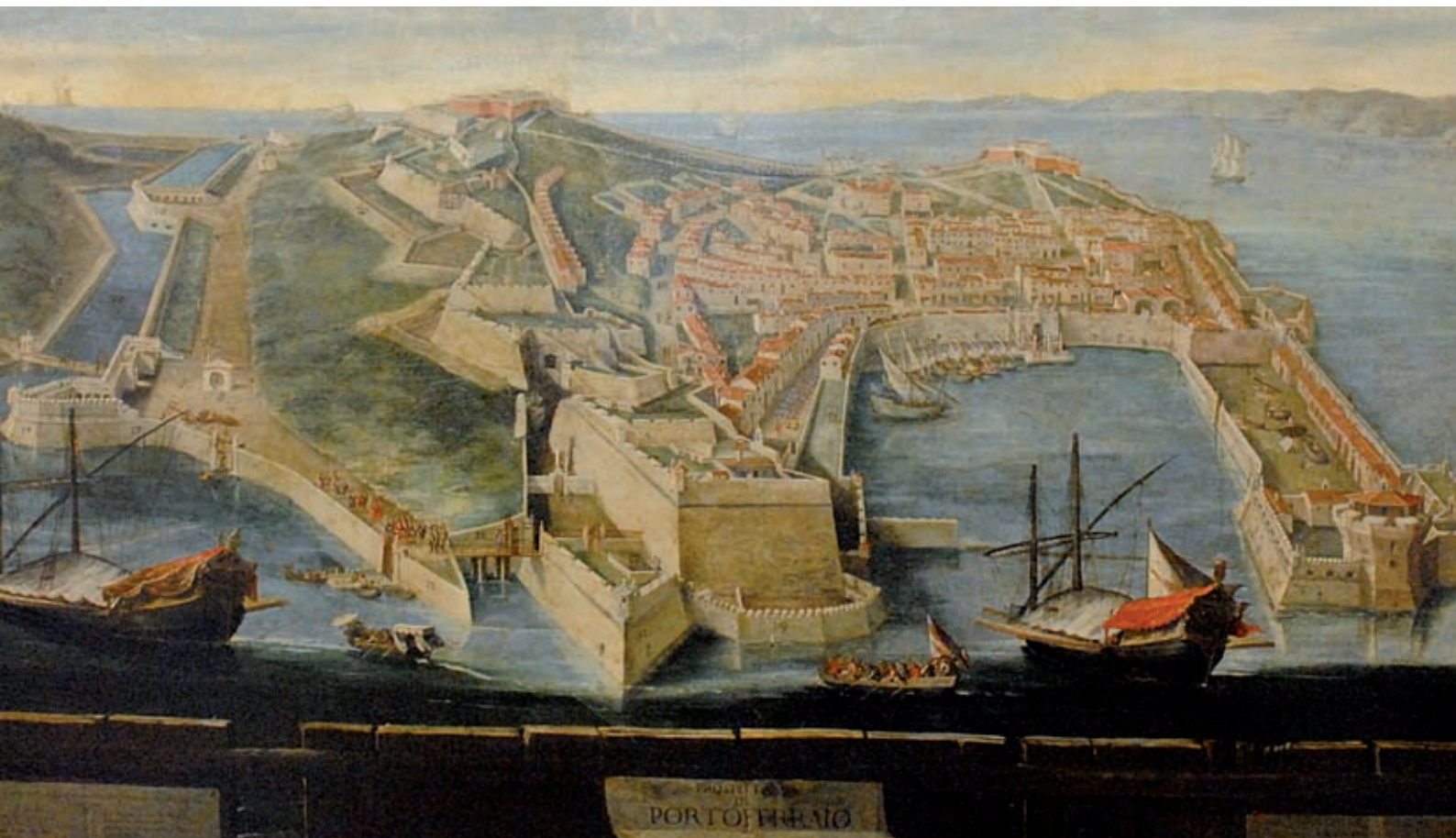
3 Anonimo, Sec XVIII, Prospettiva di Portoferraio Medicea, Pinacoteca Foresiana (Collezione Marcello Pacini), Portoferraio