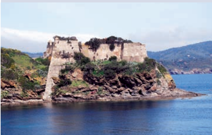
1 Forte Focardo, Capoliveri