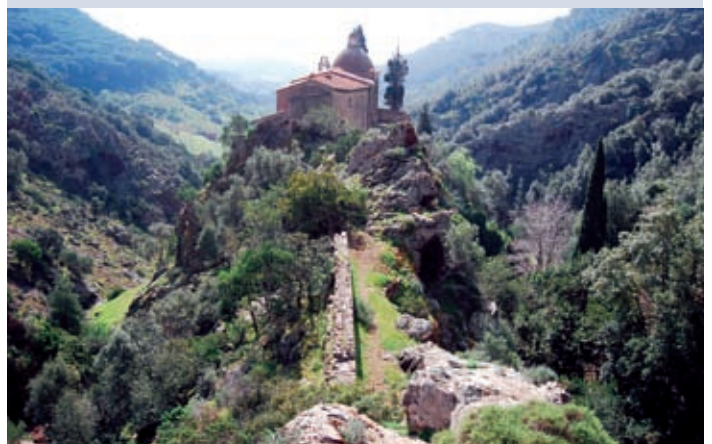
2 Santuario della Madonna del Monserrato, Porto Azzurro