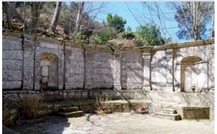
5 Teatro delle Fonti, Madonna del Monte, Marciana