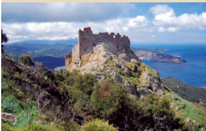
1 Castello del Volterraio, Portoferraio

Il controllo dell'Isola da parte di Populonia.