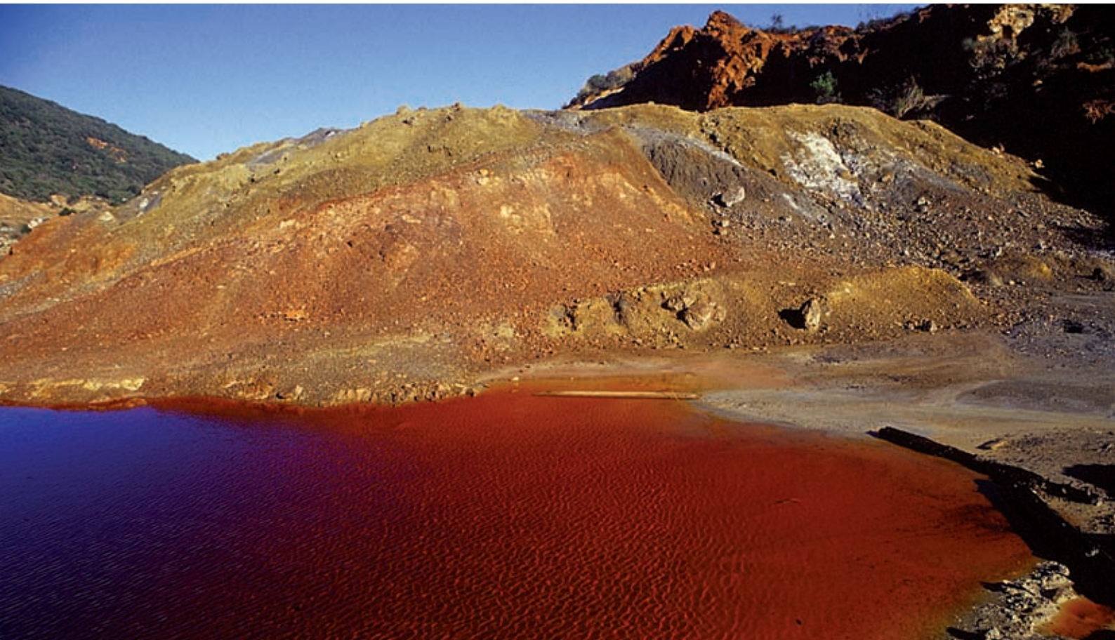
3 Laghetto di Terranera, Porto Azzurro

I tre temi archeologici – Preistoria, Periodo Etrusco, Periodo Romano – costituiranno un solo Itinerario Mostra. In questo opuscolo tuttavia sono trattati separatamente per permettere di visualizzare la ricchezza delle risorse per ciascuno dei tre temi. Con il supporto del catalogo-guida e l'ausilio di illustrazioni saranno resi leggibili anche siti di non sempre agevole comprensione.