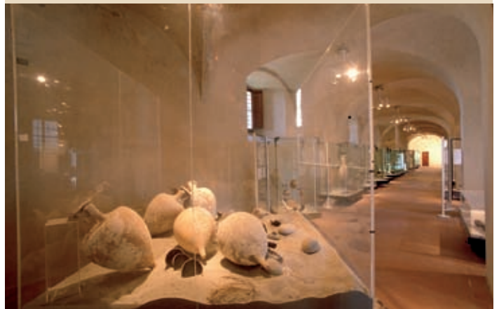
5 Museo Civico Archeologico della Linguella, Portoferraio

Marciana Marina Loc. Il Bagno (scariche di scorie ferrose).