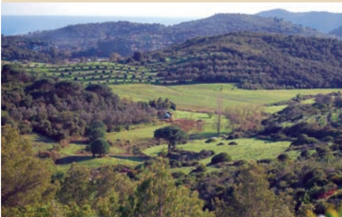
4 Veduta panoramica dal Buraccio