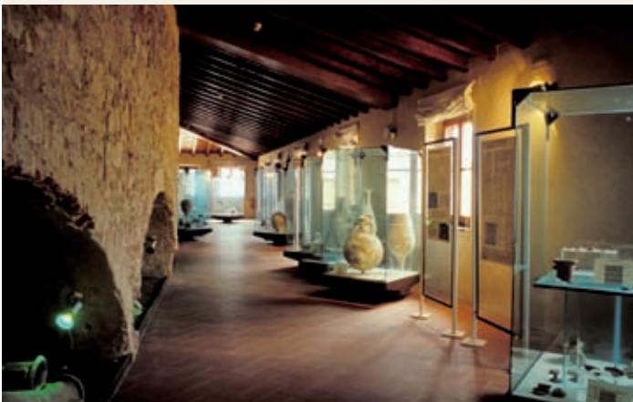
4 Museo Civico Archeologico della Linguella, Portoferraio

Domoliti pastorali/caprioli a Monte Capanne.