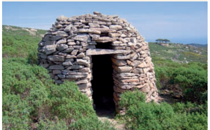
5 Domolite pastorale