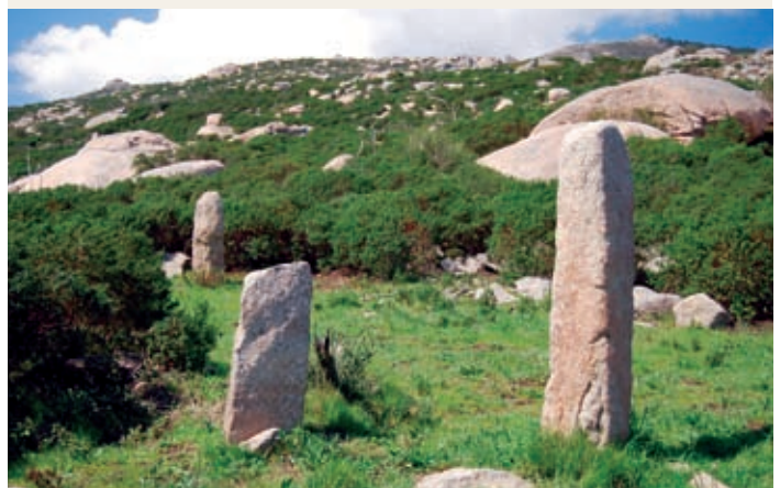
2 Sassi Ritti, Pietra Murata, Campo nell'Elba

Domoliti pastorali / caprili (Loc. Fonza).