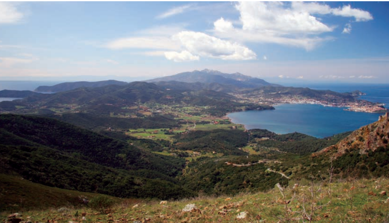
3 Veduta da Cima del Monte, Rio Marina

I tre temi archeologici – Preistoria, Periodo Etrusco, Periodo Romano – costituiranno un solo Itinerario Mostra. In questo opuscolo tuttavia sono trattati separatamente per permettere di visualizzare la ricchezza delle risorse per ciascuno dei tre temi. Con il supporto del catalogo-guida e l'ausilio di illustrazioni saranno resi leggibili anche siti di non sempre agevole comprensione.