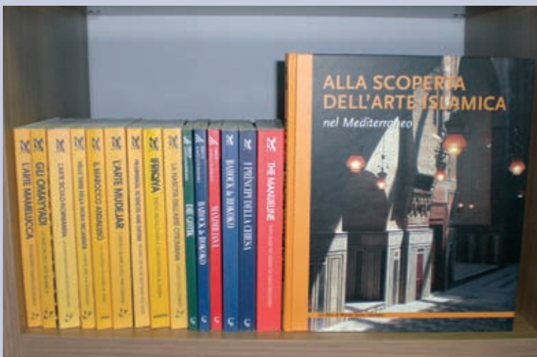
I cataloghi per gli Itinerari Mostra di Museo Senza Frontiere

Invitare a scoprire l'opera d'arte insieme al suo contesto culturale ed ambientale invece di spostare le opere, è il motivo ispiratore delle mostre organizzate da Museo Senza Frontiere.